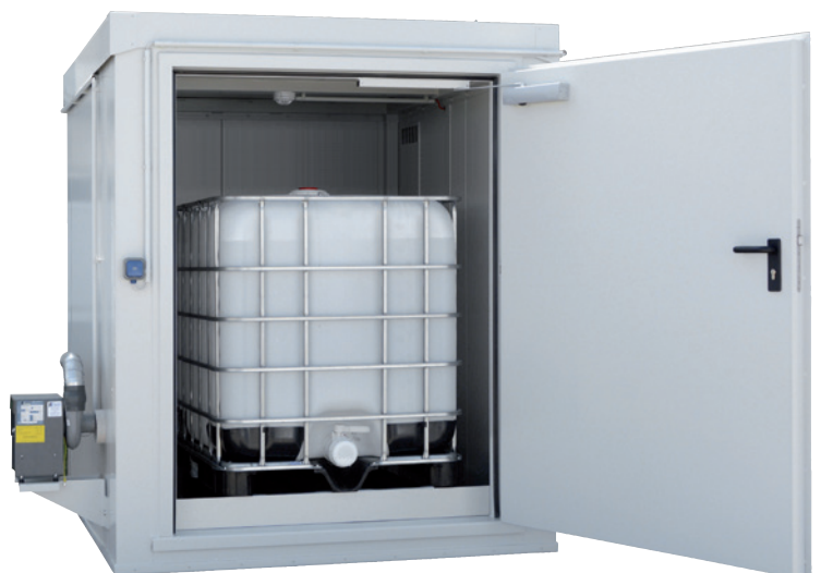
WSC-KTC 1/F90, Artikel-Nr. C64-4003-B