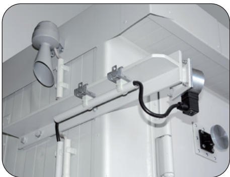
- Ex-geschützte Abluftüberwachung mit Signalhupe - Türhalteanlage