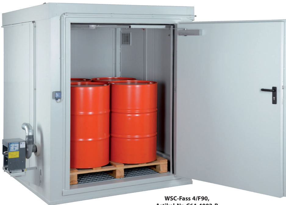
WSC-Fass 4/F90, Artikel-Nr. C64-4002-B