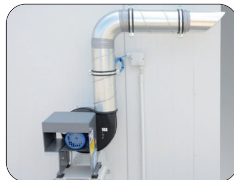
Ex-geschützter Abluftventilator inkl. Abluftüberwachung