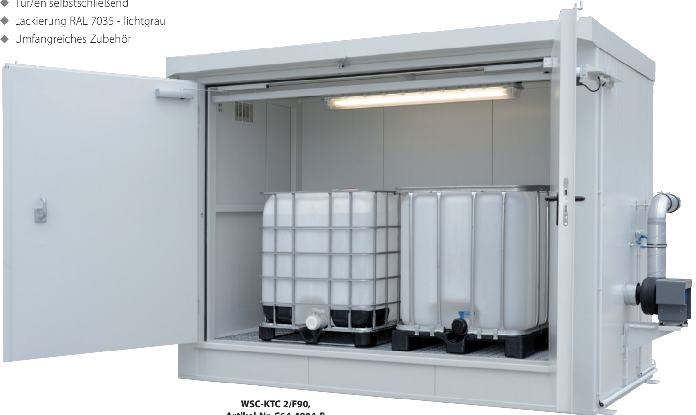
WSC-KTC 2/F90, Artikel-Nr. C64-4004-B