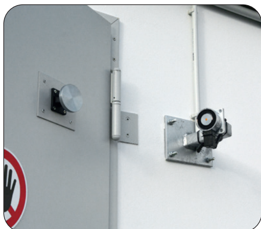
Türfeststellanlage mit allgemeiner bauaufsichtlicher Zulassung