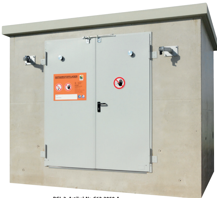
BGL 3, Artikel-Nr. C62-2050-A

Zul.-Nr.: Z-38.5-308 U Allgemeine bauaufsichtliche Zulassung DIBt Berlin