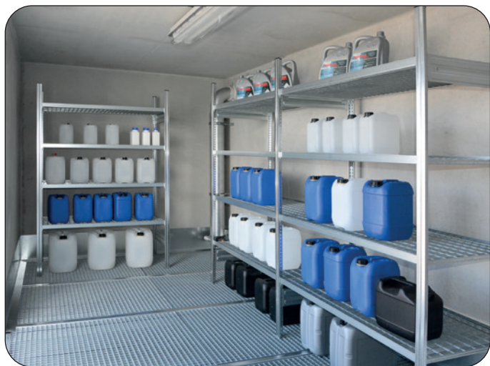
Innenausstattung mit optionalen Gefahrstoffregalen zur Lagerung von Kleingebinden