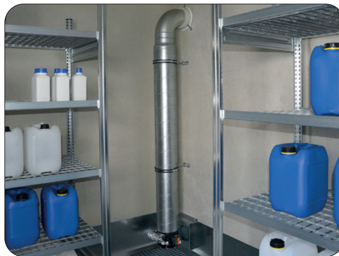
Ex-Abluftanlage inkl. Abluftkanal bis Auffangwanne