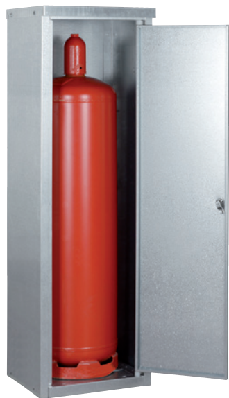
K-GFS 13, Artikel-Nr. C27-3215-B