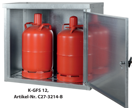
K-GFS 12, Artikel-Nr. C27-3214-B