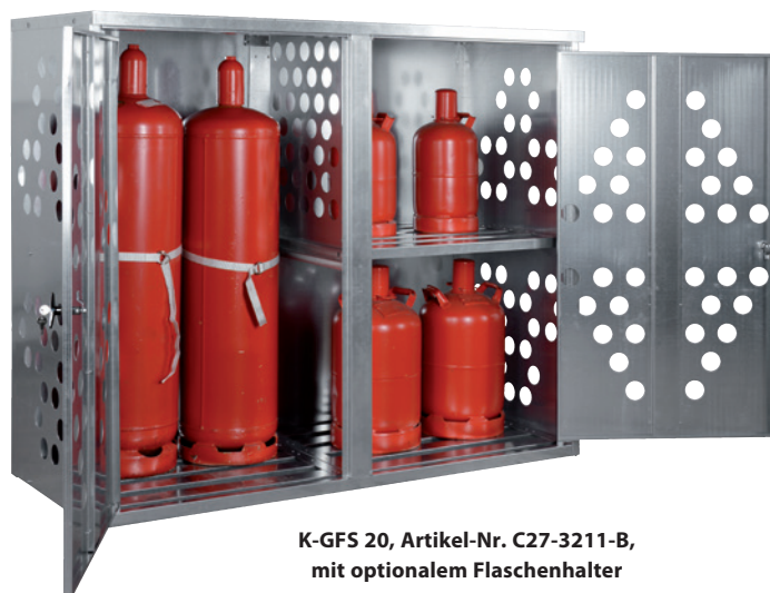
K-GFS 20, Artikel-Nr. C27-3211-B, mit optionalem Flaschenhalter