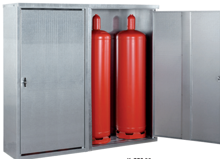
K-GFS 22, Artikel-Nr. C27-3218-B