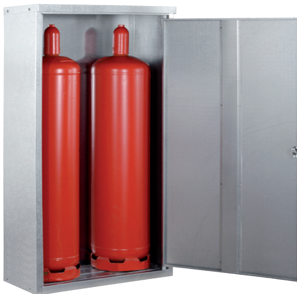
K-GFS 14, Artikel-Nr. C27-3216-B