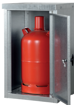
K-GFS 11, Artikel-Nr. C27-3213-B