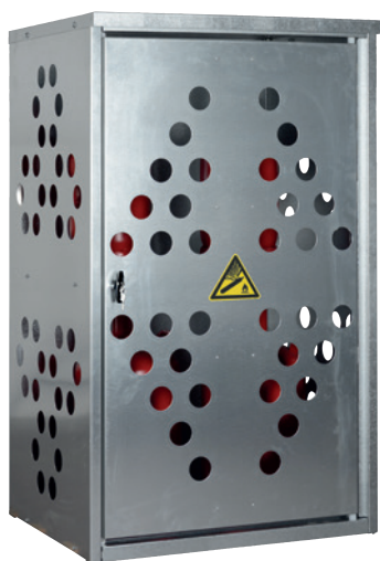
K-GFS 10, Artikel-Nr. C27-3210-B