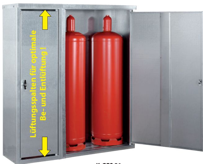
K-GFS 21, Artikel-Nr. C27-3217-B