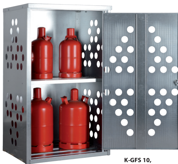
K-GFS 10, Artikel-Nr. C27-3210-B