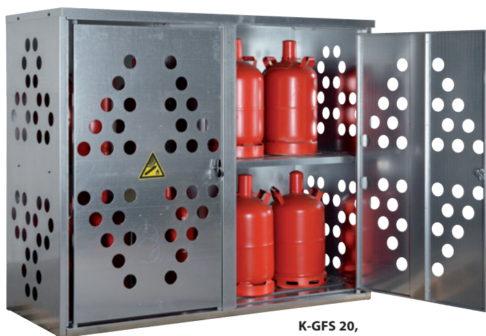
K-GFS 20, Artikel-Nr. C27-3211-B